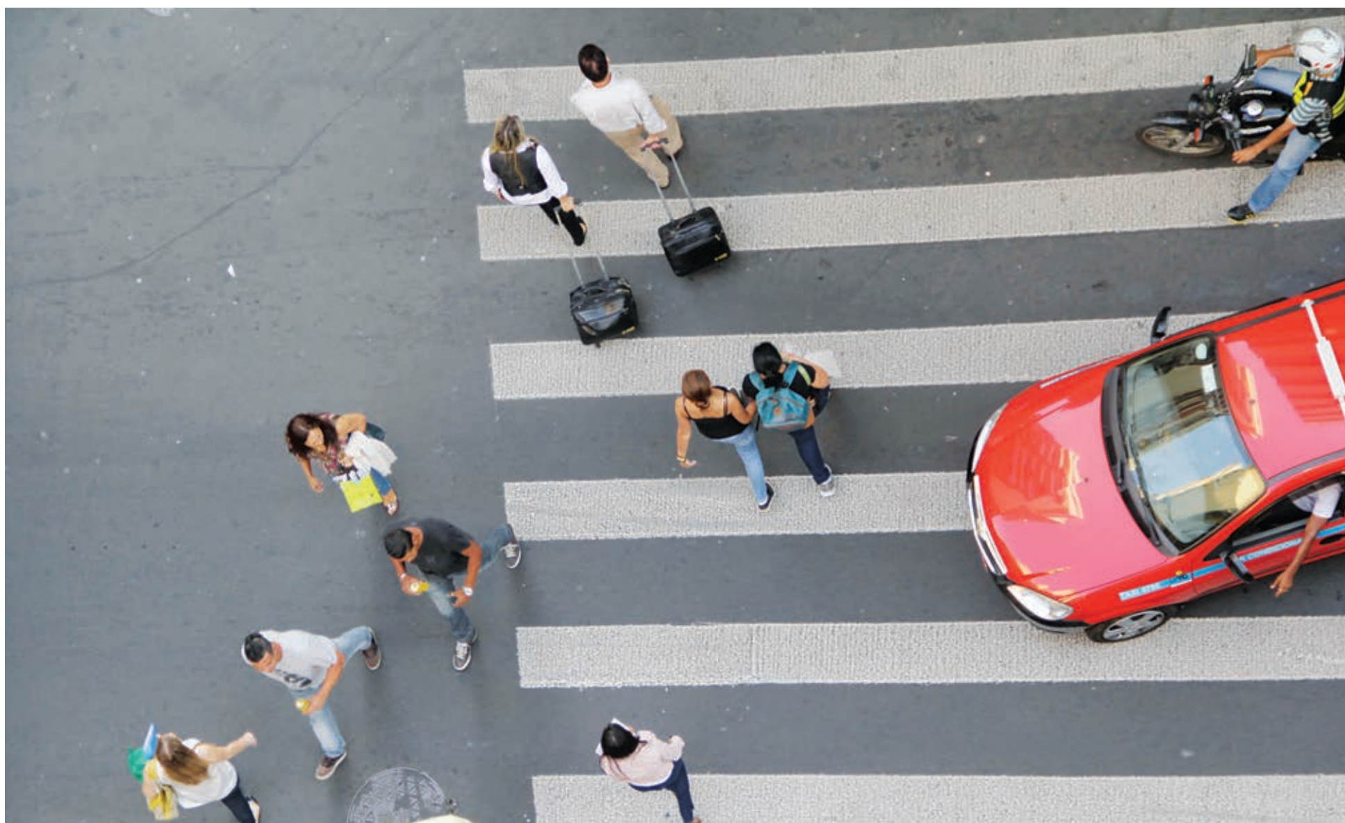
Táxi e moto param sobre a faixa enquanto pedestres atravessam a Dr. Flores junto à Rua dos Andradas, onde não há sinaleira e a preferência é de quem está a pé